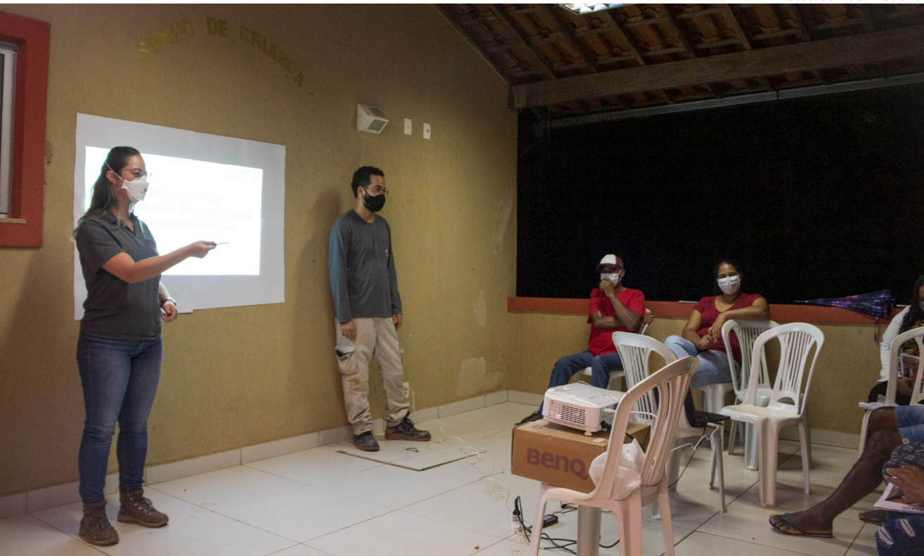
Oficina sobre o PAEBM com a comissão de São José do Jassém, que aconteceu no dia 09/02.