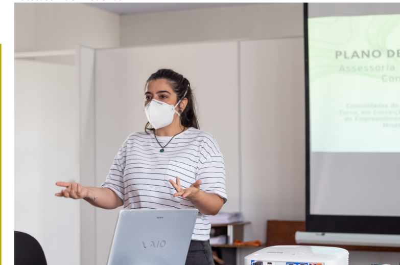
Capacitação interna da ATI 39 sobre o Plano de Trabalho.

Participe conosco das reuniões. A sua contribuição é fundamental!