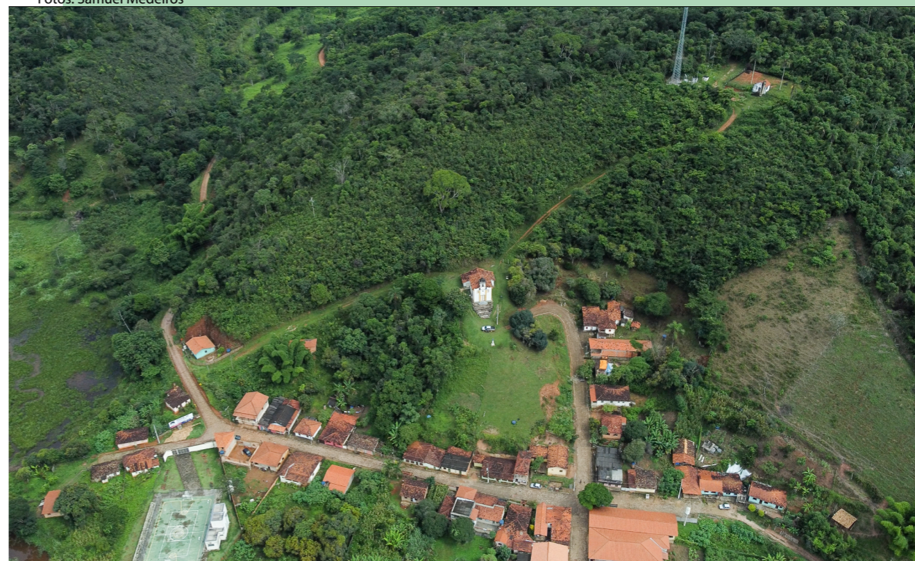
Parte da comunidade de São José do Jassém.

De acordo com a moradora de Passa Sete, além disso, não existe um diálogo efetivo entre a Anglo American e a comunidade, no sentido de apresentar devolutivas sobre os critérios de segurança da barragem.