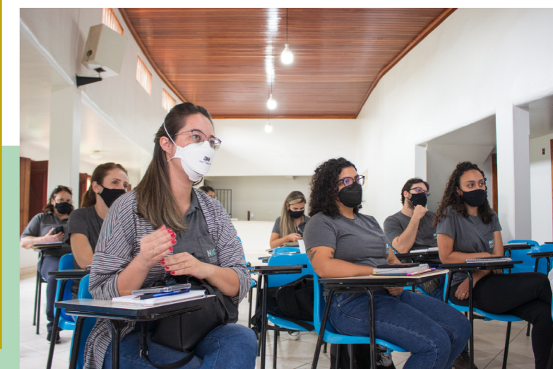
Capacitação interna da equipe sobre o RDA.