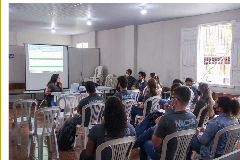
Capacitação interna da equipe Técnica.