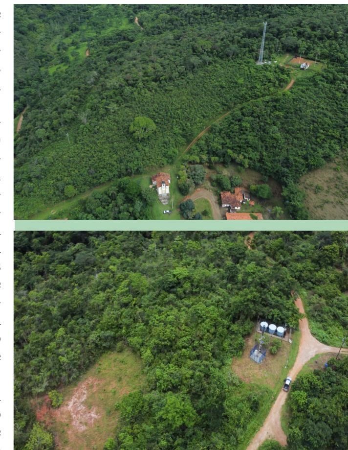
Pontos de encontro de duas rotas localizadas na comunidade de São José do Jassém.

Além do parecer técnico, a equipe da ATI 39 Nacab está realizando oficinas sobre o PAEBM e comunicação de risco nas comunidades assessoradas. Se você tem dúvidas sobre este e outros temas ligados à mineração e à ação da ATI39 junto às comunidades, entre em contato com nossa equipe.