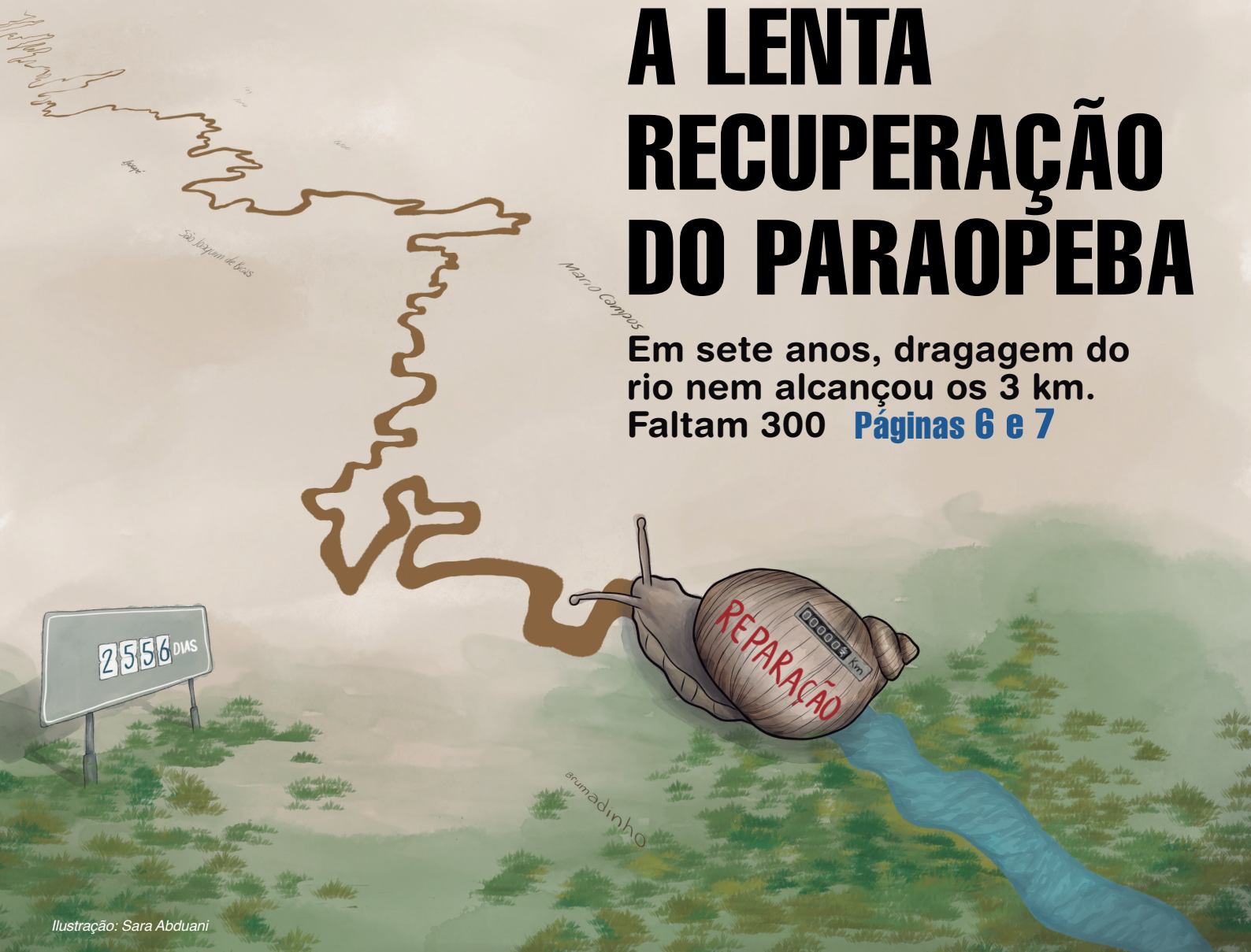
Ilustração: Sara Abduani

Em sete anos, dragagem do rio nem alcançou os 3 km. Faltam 300 Páginas 6 e 7