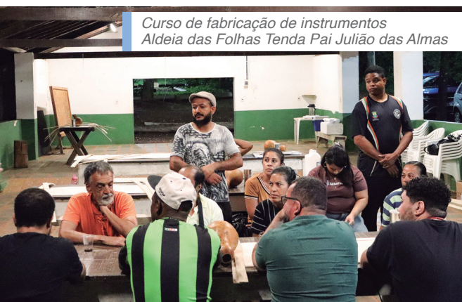
Curso de fabricação de instrumentos Aldeia das Folhas Tenda Pai Julião das Almas