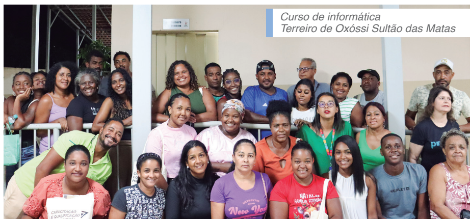
Curso de informática Terreiro de Oxóssi Sultão das Matas