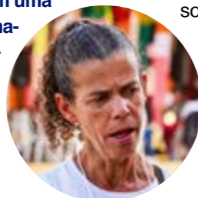
Helia Baeça Comunidade de Vista Alegre (Esmeraldas)

“Os prazos para a reparação dos danos já estão estourados. Infelizmente, não percebemos nenhuma ação de reparação do rio e do meio ambiente. Estamos em uma escuridão de informações e de percepções. Se houvesse transparência e diálogo, poderíamos, conjuntamente, propor ações”.