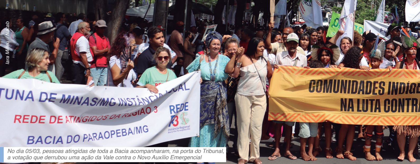
No dia 05/03, pessoas atingidas de toda a Bacia acompanharam, na porta do Tribunal, a votação que derrubou uma ação da Vale contra o Novo Auxílio Emergencial