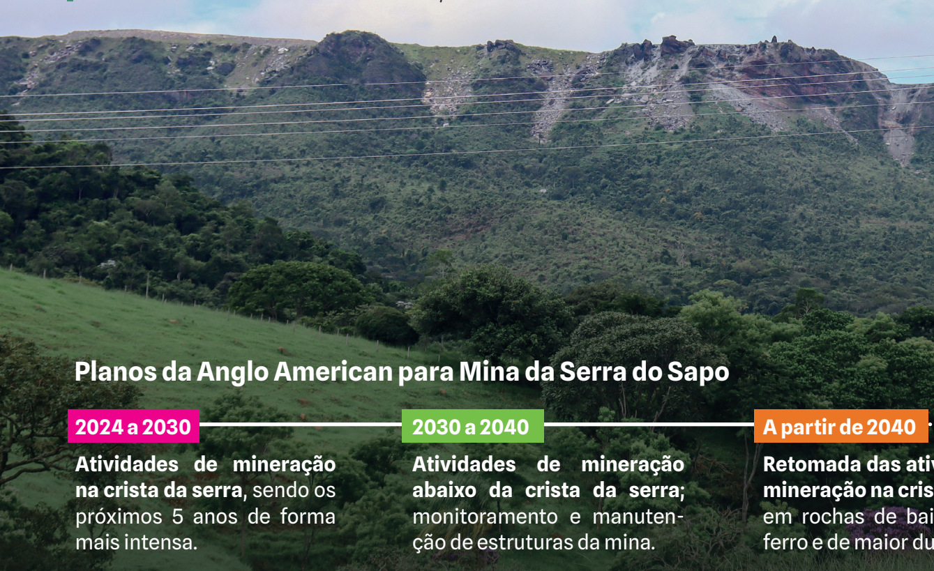
Carreamento de sedimentos na Serra do Sapo

O EIA Face Oeste foi elaborado pela Agroflor, contratada da Anglo American, e está sob análise da Feam. Nessa fase, de licenciamento prévio, o órgão ambiental avalia documentos, deve realizar audiência pública e poderá aprovar ou não as novas intervenções na Serra do Sapo. Caso aprove, irá propor condicionantes no licenciamento ambiental.