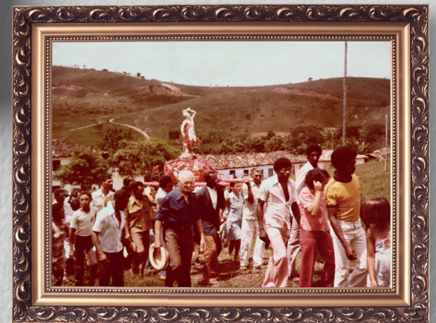
▀ Celebração de São Sebastião no Sapo, em 1980