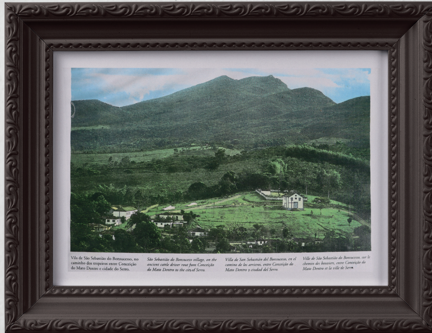
▀ Quadro guarda memória de outros tempos

Com um retrato antigo em suas mãos, Didi contextualiza: O imóvel em questão era uma pensão de sua família, à qual durante sua adolescência ela contribuía com afazeres no contraturno