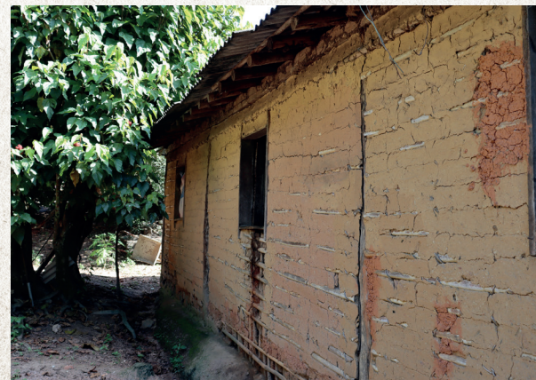
■ Casa atual de Dona Sussuca feita de pau-a-pique