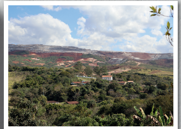
▀ Operação do Minas-Rio na Serra do Sapo