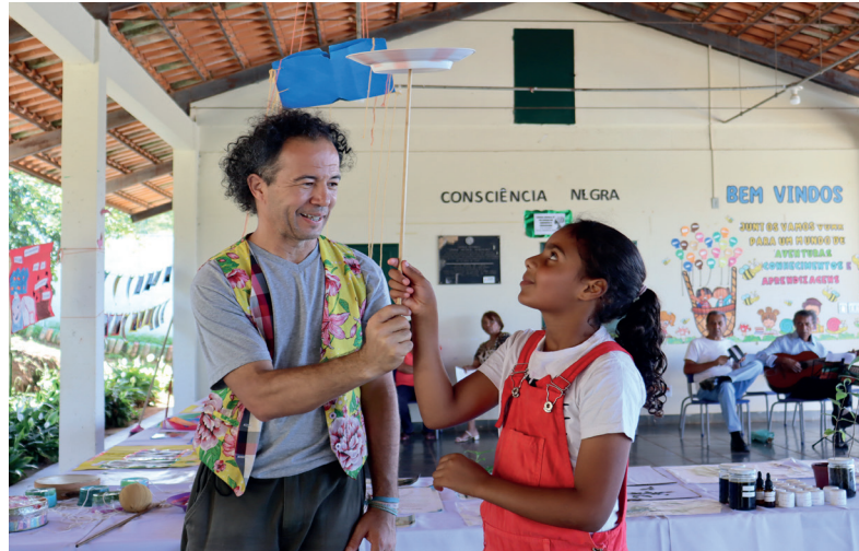
Oficina Construçõ de brinquedos e brincadeiras